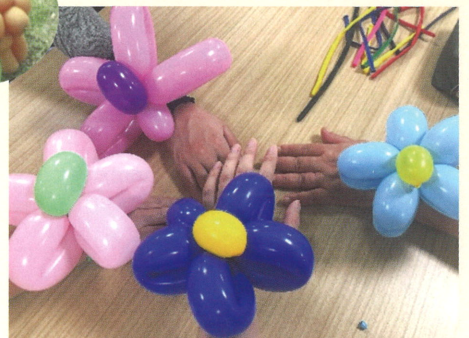
ひだまり 様 ▲