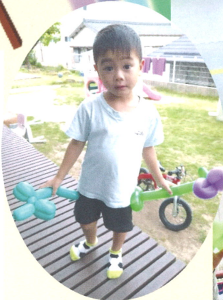
▲ OTO 様