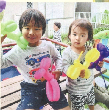
お待たせジジババ 様 ▲