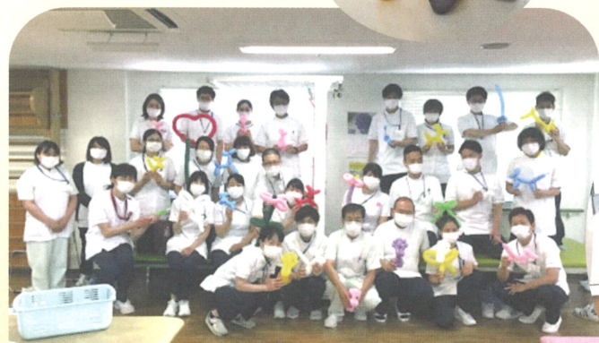
医療法人尚徳会 ヨナハ総合病院 様 ▲▶