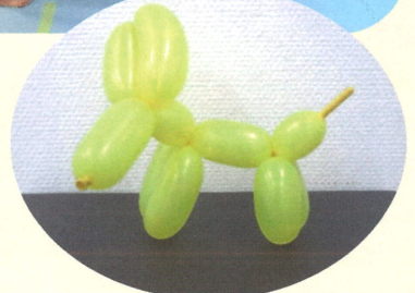
▲ 名古屋画廊 様