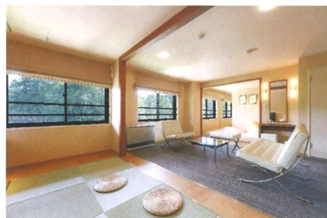
【ゆったり寛ぎの空間】

<森の中の一軒宿>では、ホテルスタッフ以外、人や他館の方々と会うことがございません。是非安心して