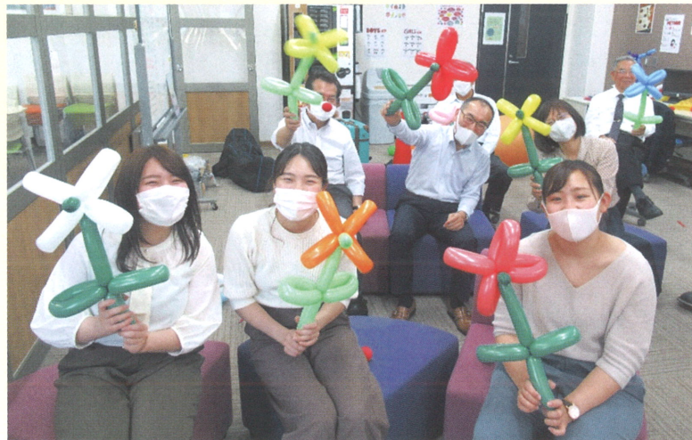
【色とりどりのお花が完成!!】

介護施設様にもお届けし、そこに入院している子どもやお年寄りにも束の間の癒しを感じてもらうことにしました。