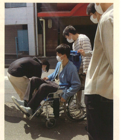
【車いすの使い方に苦戦しています】