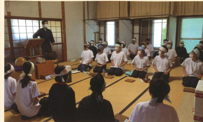
【いよいよ研修が始まります】

5月15日（月）から5泊6日の日程で、三重県桑名市にあります専光坊において、1年生が内観研修に取り組みました。この研修は、建学の精神「報謝の至誠」つまり「礼節・感謝」について深く考える行事であり、創立当初からずっと行っています。