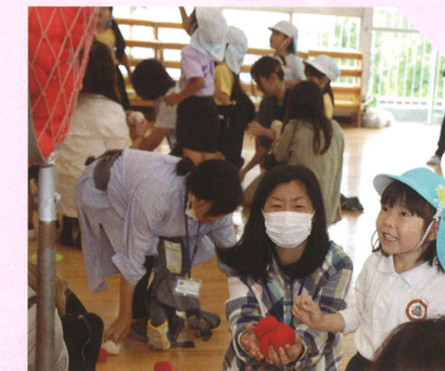
【うれしい楽しい笑顔です】

今年度から、一人親のご家庭に配慮して「家庭の日の行事」を実施しました。お父様、お母様、家族の方にご参加いただき、歌を聴いてもらったり、一緒に体を動かしたりして楽しく過ごしました。