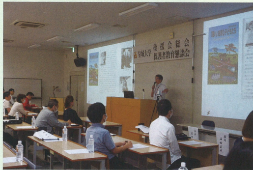
【保護者の皆様に熱心に聴講いただきました】

その後、経営学部、リハビリテーション学部それぞれの学修支援やキャリア支援の説明会・教員との個別面談を実施して、学修サポート等、保護者の皆様からの相談や不安を解消する機会となりました。