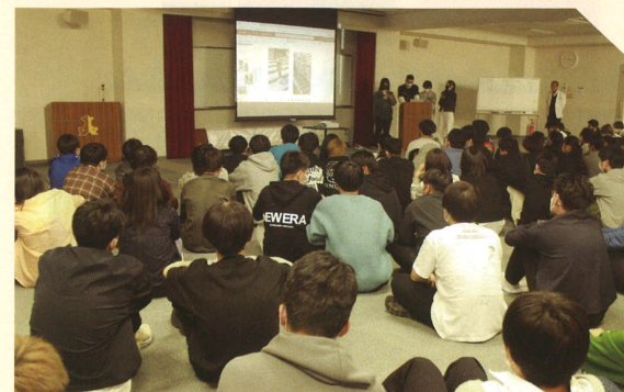
【実際に外に出て感じたことを発表】

学院セミナーを通して、これまで関わりが少なかった学生同士も交流を深めることができました。