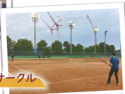
硬式テニスサークル