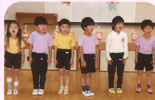
【元気に歌えました！】

年少、年中組は体を触れ合いながら、歌に合わせて動きました。年長組は親子での協同作業で「玉入れ」をしました。