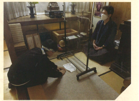
【成長を感じる立派な姿】

この内観研修を通じて、生徒たちは心を大きく成長させることができました。学んだことが研修後も生徒たちの日常で生かされることを願っています。