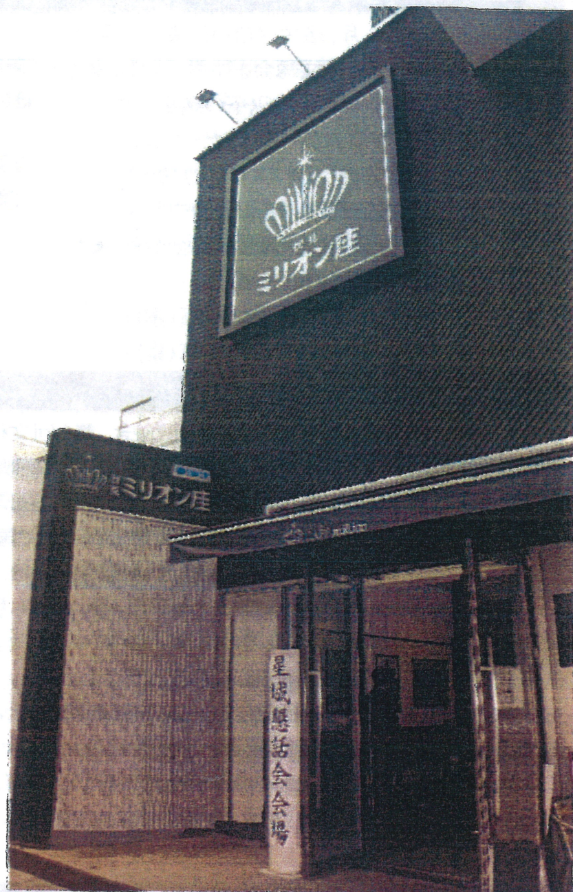
設立総会会場(伏見ミリオン座)