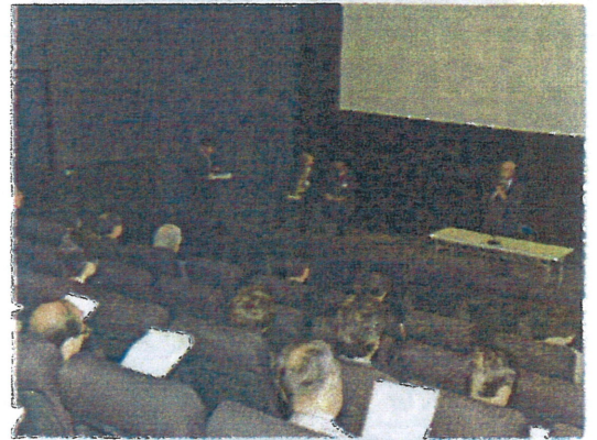
総会会場(伏見ミリオン座)