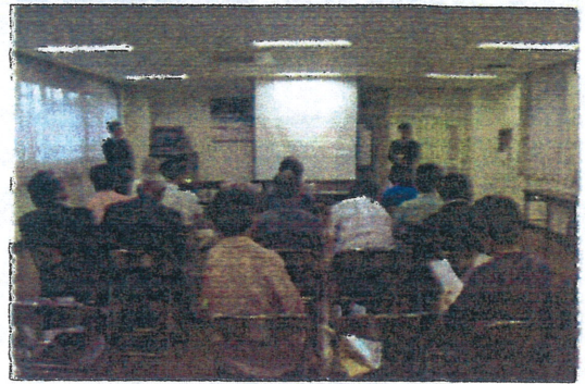
猪高コミュニティセンターにて