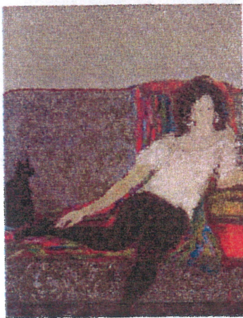
「'06 女」楠 崇子作