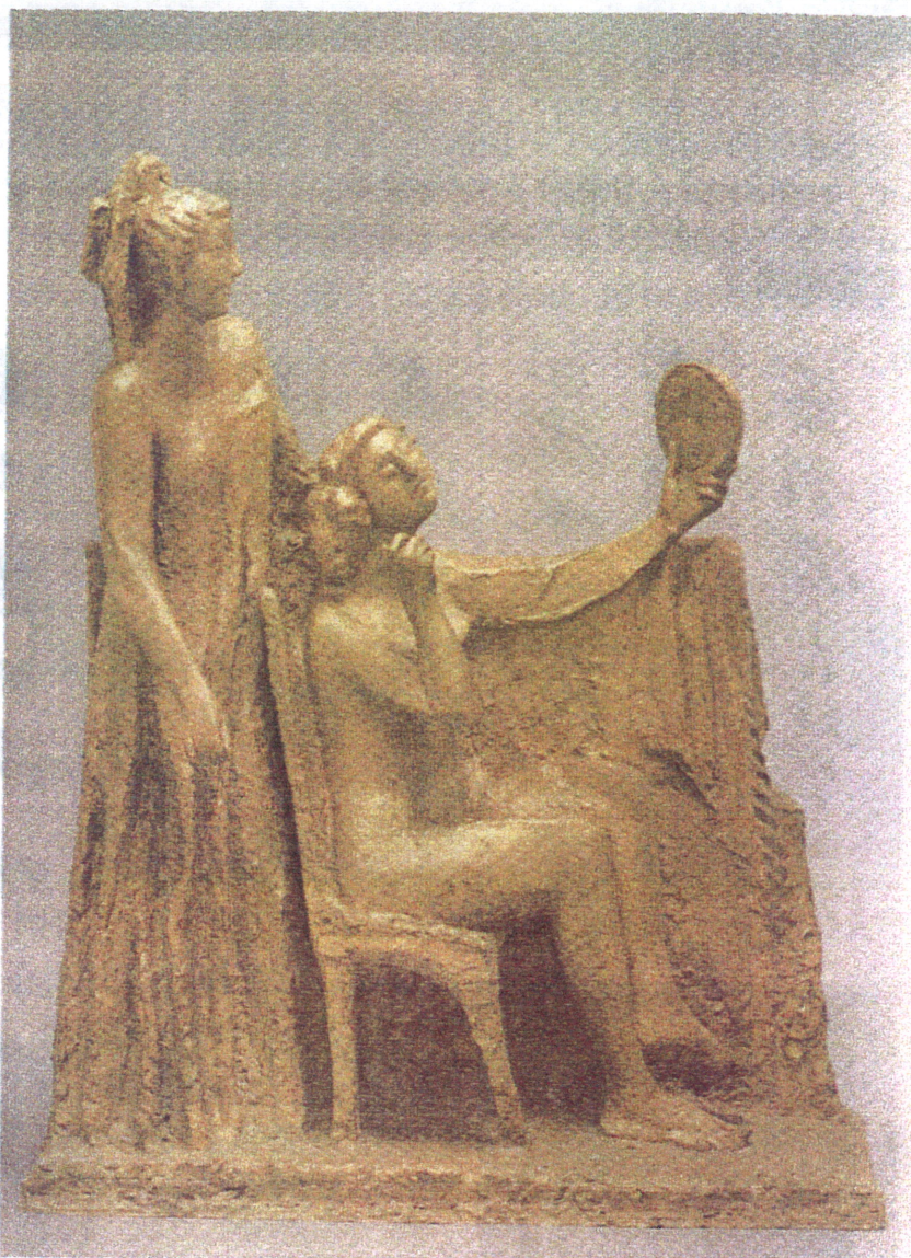
「楽屋」石田武至作(日展評議員 星城懇話会理事)