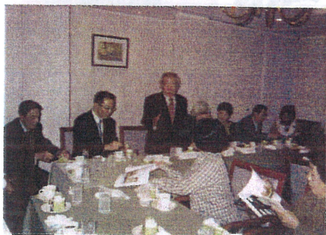
交流会(ガーデンレストラン華にて)