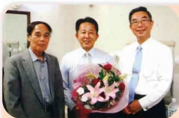
恩師である柴田会員と石田名誉会長とともに

講演の最後、予定時間を超えて積極的に家庭料理に関する質問が寄せられ、多くの方がダシの試飲をするなど、食に関する関心の高さが伺えました。終了後、氏との記念撮影を待つ人達が列を作り、アンケートでは、「本当に楽しい講演でした」「再び先生の講演を聴きたい」といった声が寄せられるなど、人気の高さを示していました。