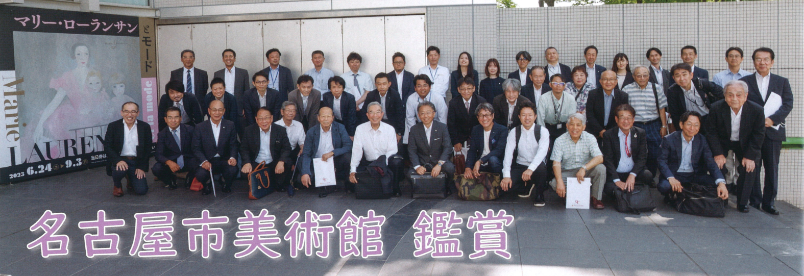
【名古屋市美術館 集合写真】

総会終了後会場を移して、今年開館 35 周年を迎えリニューアルを終えたばかりの名古屋市美術館の鑑賞会を企画しました。