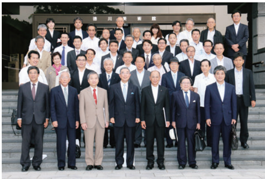
【総会終了後、徳川美術館入口前で集合写真】