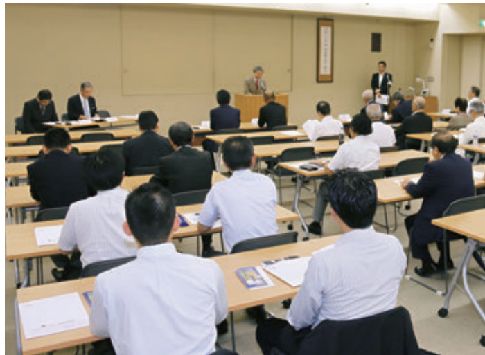
【徳川美術館講堂（総会会場）】