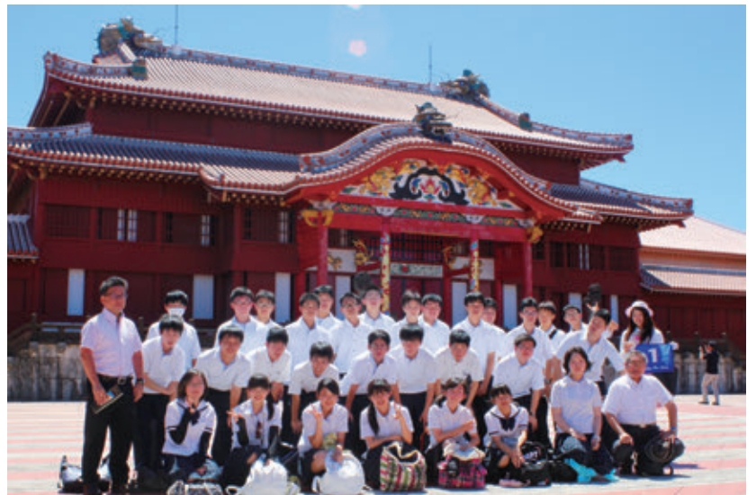
【星城高等学校沖縄修学旅行の様子】