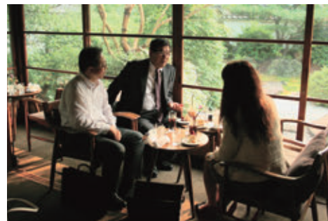
【蘇山荘 庭園を眺めながらのひと時】

鑑賞を終えられた皆さまは、ガーデンレストラン徳川園「蘇山荘」にて、コーヒー、ケーキを召し上げられ、作品を話題にご歓談されました。