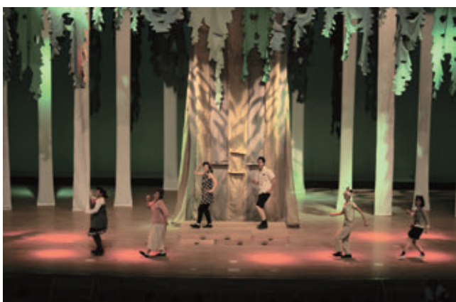
【親子観劇会 織音座「やさしいあくま」】