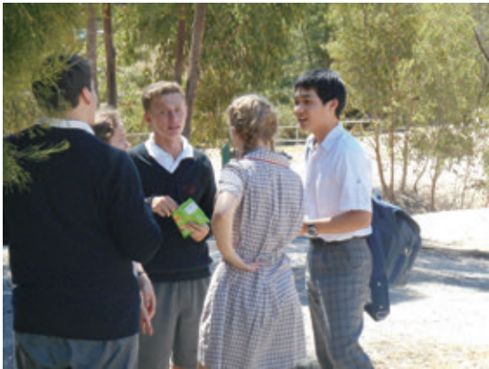
【星城中学校のオーストラリア語学研修】

近畿日本ツーリストは、「私たちは世界中の人々の出会いと感動を創造し、笑顔あふれる社会の実現にチャレンジしていきます。」という企業理念のもと、価値を提供する企業として、お客様から評価と信頼がいただけるよう努めております。お客さまの感動 × 笑顔 × 信頼 = 私たちの喜びです。