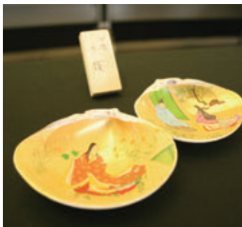
【蛇雄氏 作 源氏物語 貝絵】