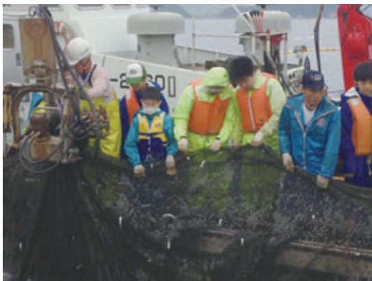
【星城中学校の自然体験（若狭）の様子】

これからも日本の未来を担う若者の成長・感動・笑顔のお手伝いができるように、さらにチャレンジしていきます。