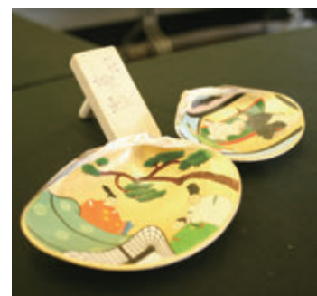
【蛇雄氏 作 源氏物語 貝絵】