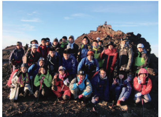
【星城高等学校富士山登山研修の様子】

近年では、グローバル社会へ向けた新しい人材育成プログラムの開発・提案、スポーツイベントをはじめとした大会サポートなど、教育旅行に関連する内容がますます多岐にわたってきております。