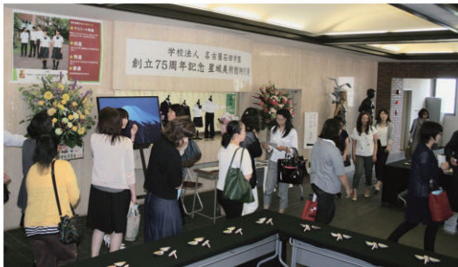
【星城高等学校 記念館ロビー 会場】